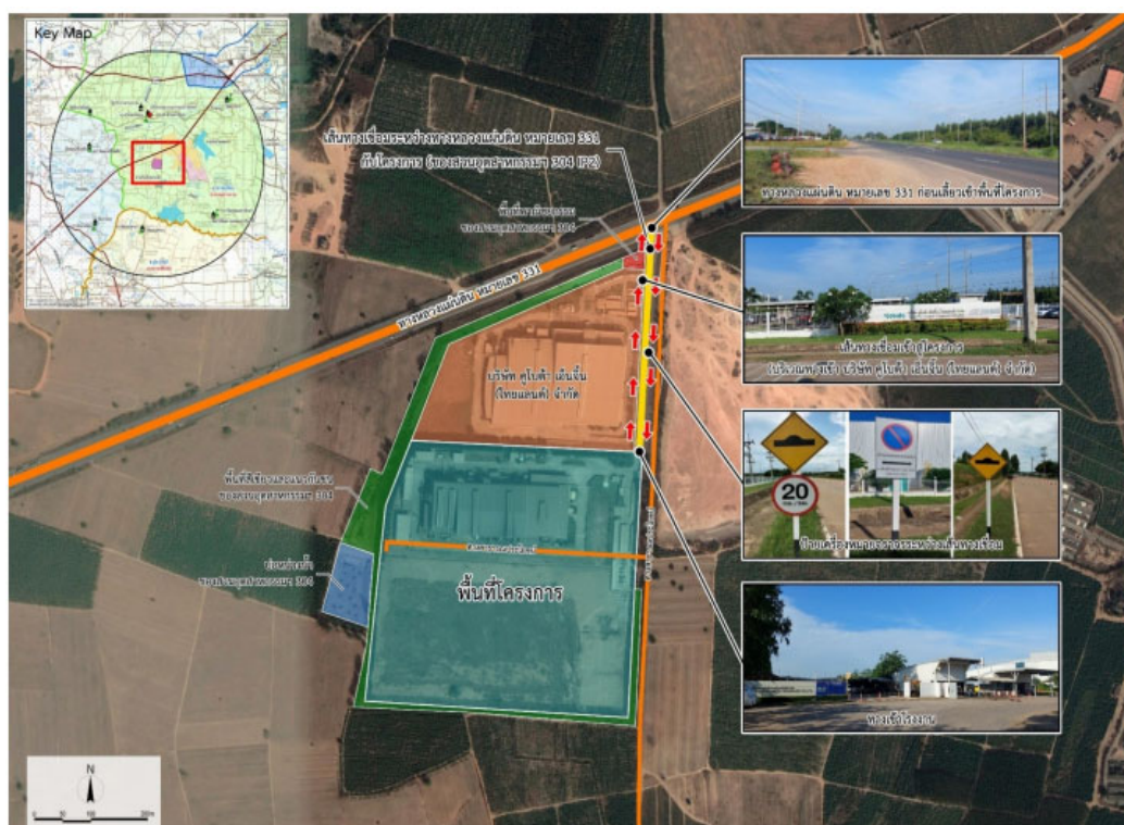
ภาพที่ 1.1 แผนที่แสดงที่ตั้งโครงการ